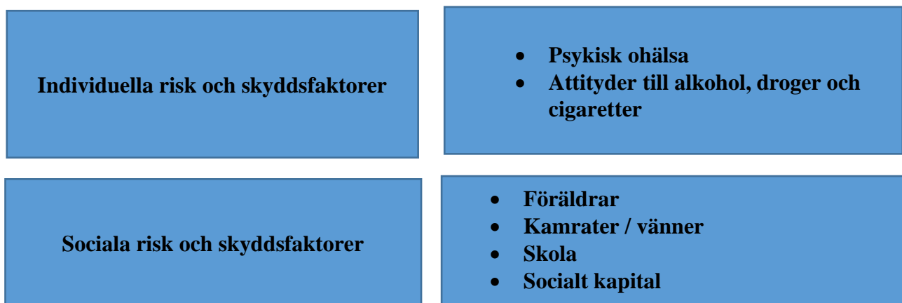
Figur 2: Studiens teman och kategorier

Under analysprocessen har fokus, utifrån syfte och frågeställningar, varit att identifiera risk- och skyddsfaktorer avseende alkohol- och narkotikakonsumtion bland ungdomar. I analysen framträdde dessa faktorer på både individnivå där ungdomarnas psykiska mående och attityder till konsumtion framträtt som kategorier, men även på social nivå där faktorer kopplade till familj, vänner, socialt kapital och skolan identifierats som kategorier, se figur 2 nedan.