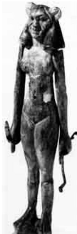
Egypten 1686-1533 f.v.t.

En studie ur metallurgiverksamhetens perspektiv som belyser auktoritära strukturer i forna Egypten