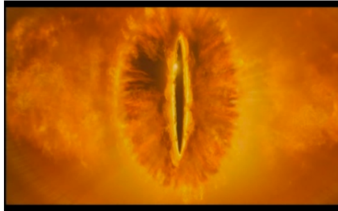
Sagan om ringen (00.29.02)

Saruman upphöjer Sauron nästan till en allseende gud i Sagan om ringen när han säger att “hans blick skär genom moln, skugga, jord och kött” (00.46.09). På vilken sätt den i stället goda kraften i filmerna gestaltas och tar sig för uttryck är mindre tydlig. 20