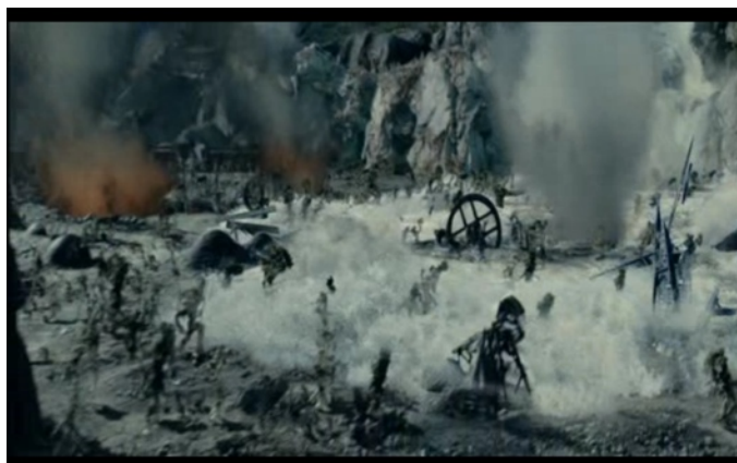
Sagan om de två tornen (03.11.37)

Att Midgård “övervakas” ständigt av högre, godare makter antyds i alla tre filmerna. Tydligaste exemplet på detta nämndes tidigare, och det är ur filmen Sagan om ringen då Gandalf ger Frodo uppmuntran i Moria-grottorna om att “det finns andra krafter i den här världen, Frodo, förutom ondskans vilja” (02.03.53). Det finns således alltid “andra krafter” än “ondskans vilja” som kan ställa saker och ting till rätta i större utsträckning. De levande träden enterna är en del av denna goda vilja som svämmar över Sarumans rike Isengård och alla de illgärningar som försegår där i en stor syndaflod. 51