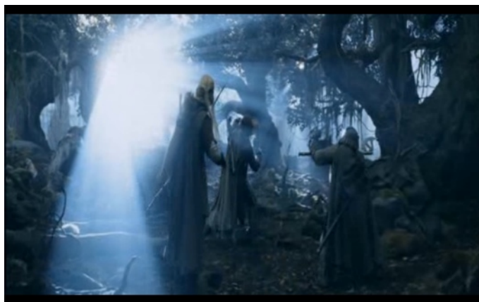
Sagan om de två tornen (00.50.41)