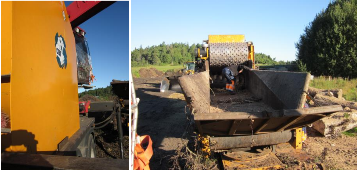
Figur 5. Tillträdesväg till kranhytt respektive inmatning till sönderdelningsaggregat.

För mobil kross 2 uppmärksammades risken för att falla ner från trappstegen när föraren ska gå in i hytten. Framförallt är det svårt när hytt dörren ska öppnas och föraren först måste gå förbi dörren och sedan har mycket liten yta att stå på när dörren öppnas. Även när huggstålen ska ses över klättrar föraren upp på en stege. Förutom risken att trilla ner är arbetsställningen besvärlig vid detta moment.