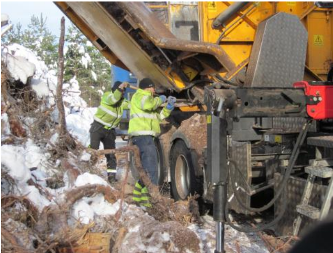
Figur 4. Rengöring av inmatning.

Föraren av lastbil 3 uppgav att det var tunga lyft, ca 25 kg, att byta huggstål. Han slipade själv huggstålen och uppgav att han tidigare skurit sig på huggstål vid hantering av dessa. Manualer saknades till den ihopsatta sönderdelningsutrustningen. Kranens smörjpunkter kunde nås från marken eller från inmatningsbordet.