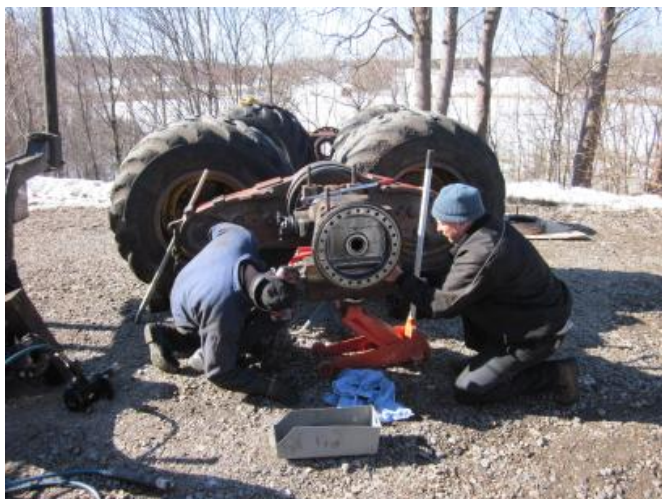
Figur 1. Uppallning av bakvagn.

Vid reparationsarbetet använde servicemannen hörselskydd vid användning av tryckluft och slägga. Han använder alltid handskar som är gummibelagda och stoppar en del olja från att nå händerna. Därtill används kängor med ståltåhätta, samt knäskydd i overallen som behövs då han står på knä på marken och på stegen. Servicemannen har med sig lådor eller plåtar att lägga verktyg och delar på så att de inte ska tappas bort. Avmonterade delar brukar läggas i den ordning de plockas bort så att det ska vara lätt att återmontera. Serviceman och förare hjälptes åt och pratade lättsamt under arbetet. Föraren använde inte handskar och hörselskydd. Vid renblåsning av damm använder servicemannen skyddsglasögon, annars kliar det i ögonen långt efteråt.