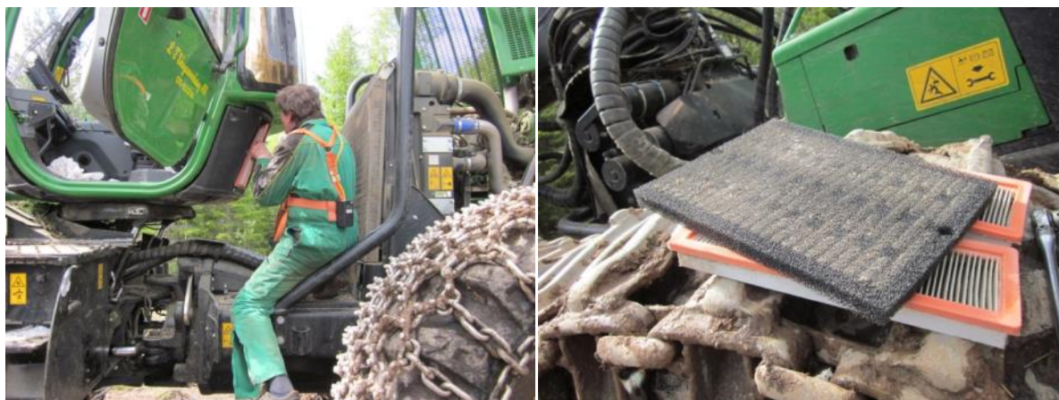
Figur 2. Byte av luftfilter.

Transmissionsfiltret satt illa till och var svårt att byta. Några oljefilter baktill var lättare att komma åt men arbetet måste utföras från stege eller ståendes uppe på maskinen. Föraren hoppade ner från maskinen, en höjd på ca 140 cm. När all olja var uttömd och filtren var bytta pumpades ny olja in till de olika oljeträgen med en handpump. Servicen avslutades med att oljetrycken kontrollerades i maskinens dator.