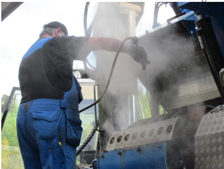
Figur 3. Renblåsning med tryckluft i samband med byte av huggstål.

Förare av skotare 13 använde elektrisk mutterdragare vid byte av huggstål.