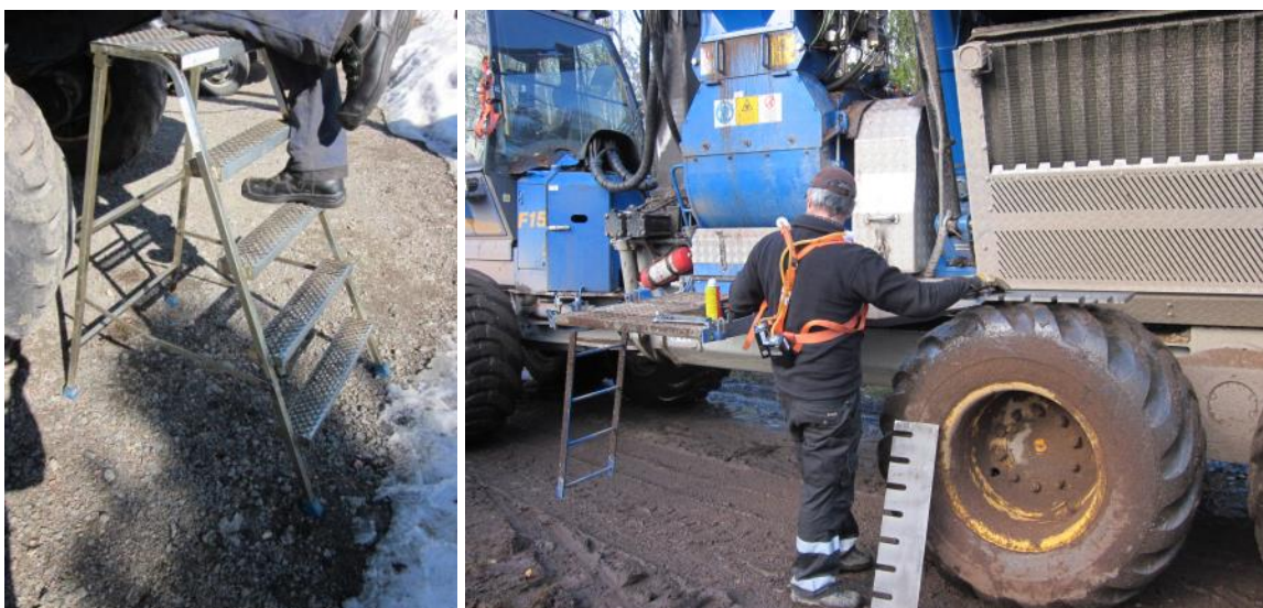
Figur 7. Trappstege respektive huggstålsbyte.

Genom att använda en elmotor för drivning av hydraulpumpen för huggen då dieselmotorn var avstängd underlättades förarens arbete. Trumman kunde därmed roteras långsamt med låg belastning för föraren. Långa spärrskaft användes för att underlätta arbetet med att lossa hårt åtdragna muttrar. Användning av mindre lämpliga verktyg, såsom skiftnyckel istället för fast nyckel, medförde att verktyget slant och delar föll ner på marken samtidigt som risk fanns för skador på händer. En förare uttryckte att det vore bra om daglig tillsyn kunde göras utan verktyg.