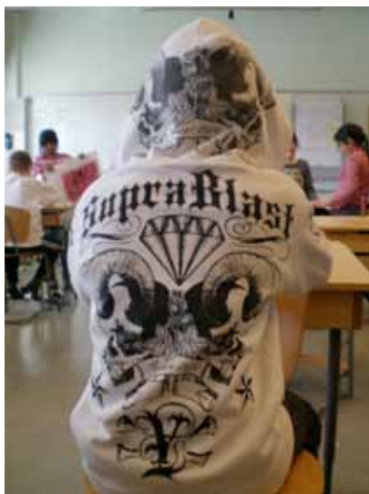
Text som markör.

Morgonens vardagliga rutiner före skolstart kan innebära att barnet sitter vid ett bord och läser på mjölkförpackningen och därefter borstar tänderna med tandkräm där förpackningstexten informerar om tandkrämens förträffligheter. På väg till skolan finns kanske namn på affärer och reklam. Dessa upplevelser handlar om läsning, men skrivande kan förekomma eftersom barnet på vägen till skolan med stor sannolikhet använder en mobiltelefon för att skicka ett SMS. Text på barns vardagskläder är allmänt förekommande och dessa finns med in i klassrummen där de beundras, kommenteras och värderas av eleverna. Vad det står på kläderna vet barnen för det mesta men kanske inte riktigt vad det betyder. Tydligt är att text inte enbart består av bokstäver utan att det även inkluderar andra tecken och bilder, vilket framkommer på bilden härintill.