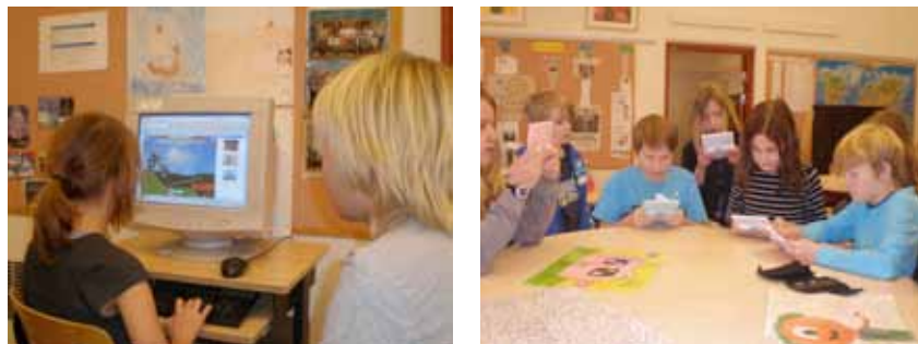
Skrifthändelser under raster i klassrummet.

eleverna. Den högra bilden visar flera elever som sitter tillsammans runt ett bord i klassrummet med varsin spelkonsol.